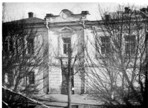
Дом Голубиновых на ул. Адмиральской, 5, фото до 1919 г