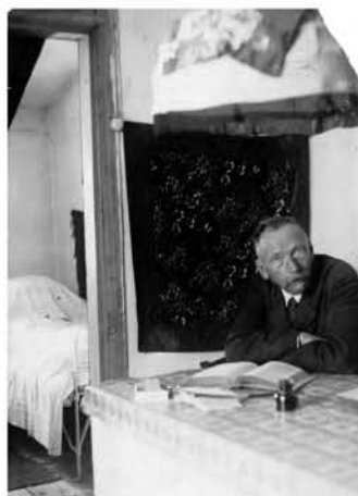
Е.П. Голубинов в последние годы жизни