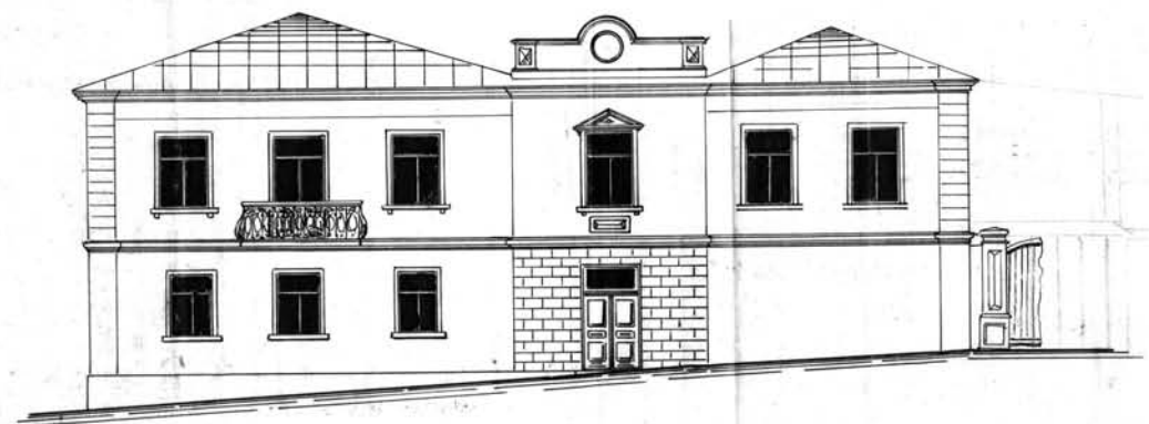
Дом Голубиновых на ул. Адмиральской, 5. Фасад 1913 года