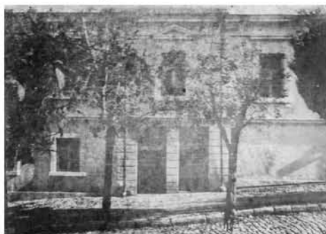
Дом на ул. Адмиральской, 5, после капитального ремонта 1919 г., виден второй изолированный вход